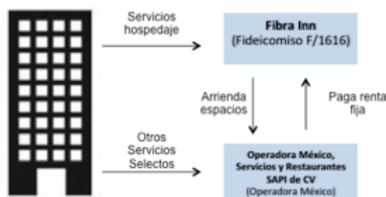
Diagrama Hoteles de Servicio Selecto y Servicio Limitado

En consecuencia, los Otros Servicios Selectos son ingresados y facturados por Operadora México, la cual pagará los insumos directos y gastos de operación por la prestación de dichos servicios, así como el respectivo Impuesto Sobre la Renta. Debido a que el importe de ingresos por los Otros Servicios Selectos es poco significativo (en promedio 3% sobre los ingresos hoteleros), la Administración de Fibra Inn decidió establecer una renta fija mensual por concepto de arrendamiento de espacios, equivalente a un promedio de Ps. 182.5 por metro cuadrado por mes, que representan un 55% de los ingresos recibidos por los servicios prestados en estos espacios. El Fideicomiso F/1616 recibe este ingreso por concepto de arrendamiento, ya que es el único concepto bajo el cual una FIBRA puede recibir ingresos.