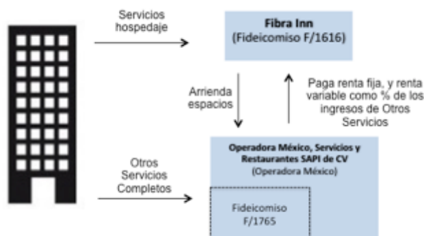
Diagrama Hoteles de Servicio Completo

El propósito buscado con la incorporación del Fideicomiso F/1765 es que exista una entidad tercera que reciba los montos de ingresos sobre los cuales se aplica el porcentaje para determinar la porción variable de la renta de los distintos hoteles. Con esto se garantiza una total independencia y transparencia.